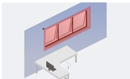
Protection des fenêtres automatisées