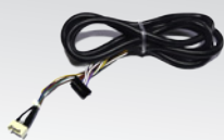
Câble adaptateur IRIS ON C / LZR-P220