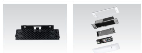
Accessorio di montaggio Montaggio a soffitto