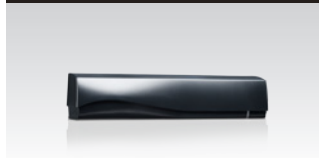
Breed radarveld: 4 m x 2 m @ 2,2 m Smal radarveld: 2 m x 2,5 m @ 2,2 m