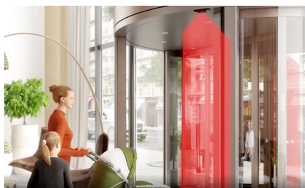
Protezione zona cesoimento

LZR®-FLATSCAN REV PZ protegge il bordo di chiusura frontale della porta. A seconda del tipo di porta, può essere utilizzato anche per proteggere il bordo di chiusura del battente.