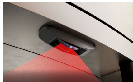
Montaggio a soffitto