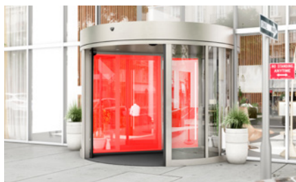
Seguridad en la zona de la hoja