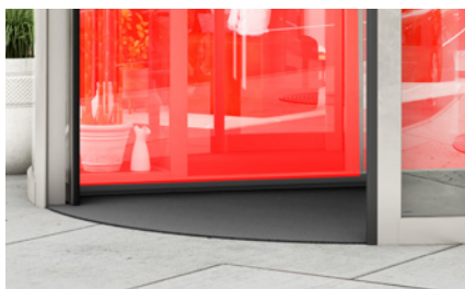
Zona más baja sin cobertura (cuerpo de prueba CA detectado en todas las posiciones)