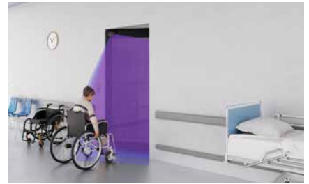
Ouverture de la porte par le champ de détection