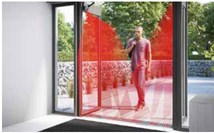
Onafhankelijk van vloertype en omgeving