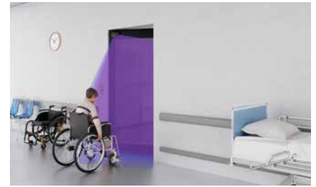
Deuractivering via het detectieveld