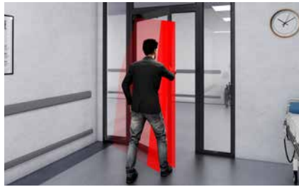
Uitgebreide beveiligingszone tijdens het sluiten