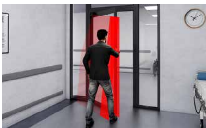
Utökat säkerhetsområde vid stängning