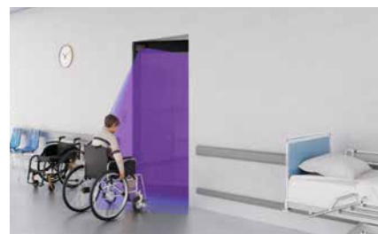
Öppningsfunktion när någon närmar sig dörren