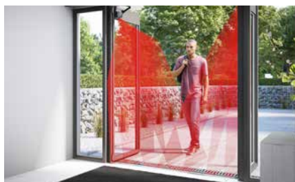
Oberoende av golvtyp