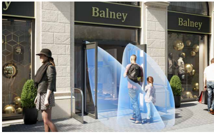
Double porte battante