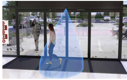
Filtering van dwarsverkeer